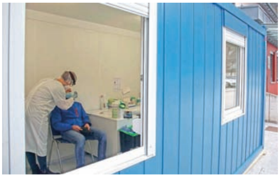
Testiranje s hitrimi antigenski testi v kontejnerju pred zdravstvenim domom na Racovniku