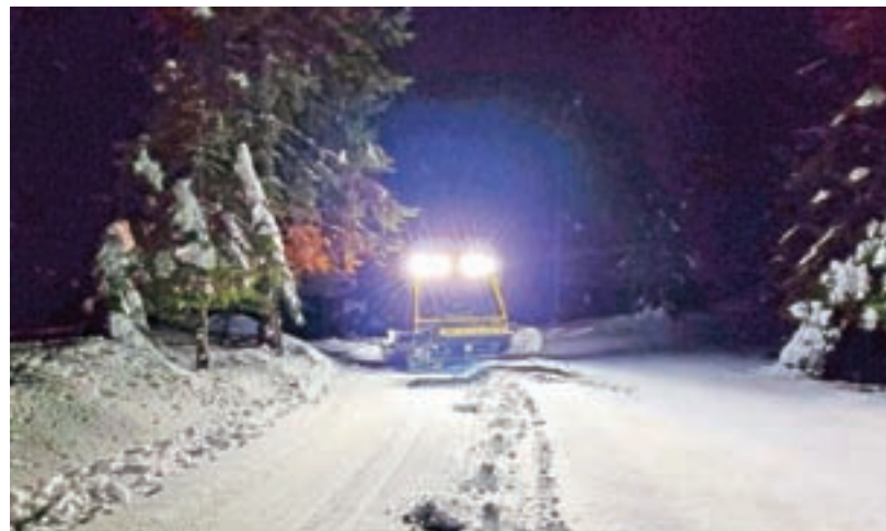
Za urejenost tekaških prog na Jelovici skrbijo v ŠD Dražgoše.

Tekačev bi bilo zagotovo še več, če bi se iz avtomobila lahko podali direktno na progo. Se je dalo, a so to zmogli le boljše pripravljene, drugi pa najprej od parkirišča nad zadnjimi hišami v Dražgošah en kilometer peš do vrha, tako da se že dobro ogrejeje. Tisti, ki tečejo na Jelovici, se bodo zagotovo strinjali, da je že prav tako, da ni gneče, kot jo beležijo ponekod drugje. Trenutno se da teči do Bičkove skale, naprej je kopno. Proge pa so še v zelo dobrem stanju. Urejajo jih po potrebi. Za njihovo uporabo ni treba plačati, so pa zaželeni prostovoljni prispevki, s pomočjo katerih jih, poleg prostovoljnih ur, urejajo. "To so visoki stroški. Večinoma smo odvisni od prostovoljnih prispevkov, pomaga nam tudi Občina Železniki v okviru razpisa za šport. Trudimo se, da so proge dobro urejene. V letošnji zimi smo imeli veliko dela tudi z odstranjevanjem podrtih dreves. Če bi gledali s finančnega vidika, bi hitro zaključili," je pojasnil Lušina in poudaril, da dokler bo tako, bo šlo. "V društvu smo zagnani in pripravljene delati. Za urejanje prog nas skrbi med pet in deset. Veseli smo, da so prebivalci razumevali in pripravljene tudi potrpeti. Ob lepih koncih tednov je bilo parkirišče polno, avtomobili parkirani tudi ob cestah, kje celo na kakšnem dvorišču. Poleg tekačev je bilo tudi veliko sankočev, družin pa tudi pohodnikov." Če