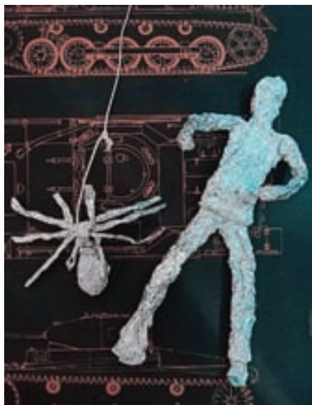
Jasna Tukić, 4. b