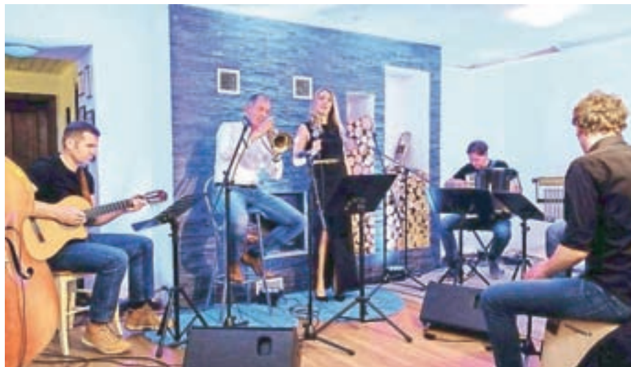
Utrinek s snemanja Valentina v mehurčku