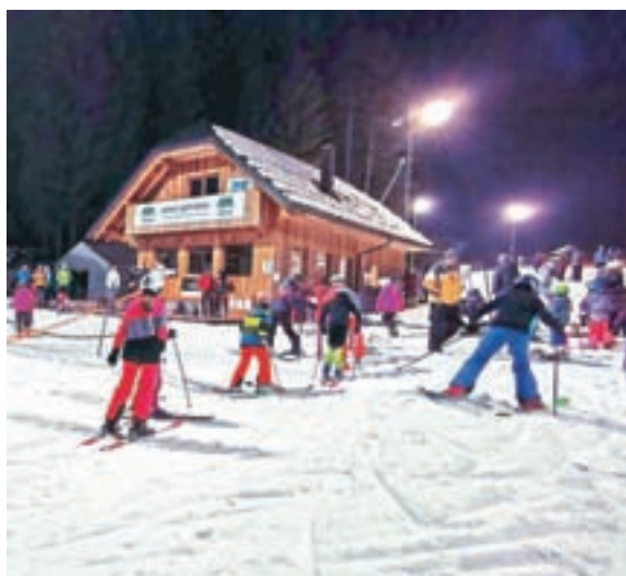
Na Rudnem so zadovoljni, da so v tem tednu lahko začeli izvajati smučarske tečaje.