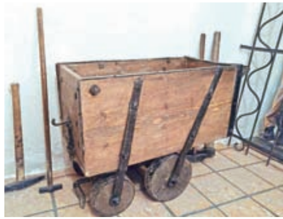
Rudosledni znak in kopija vozička iz rudnika na Ratitovcu

stal ob vhodu v rudnik kot dovoljenje oblasti za izkop rude (iz leta 1885). Drugi predmet, ki pripoveduje o rudarski aktivnosti, pa je voziček za prevoz rude.