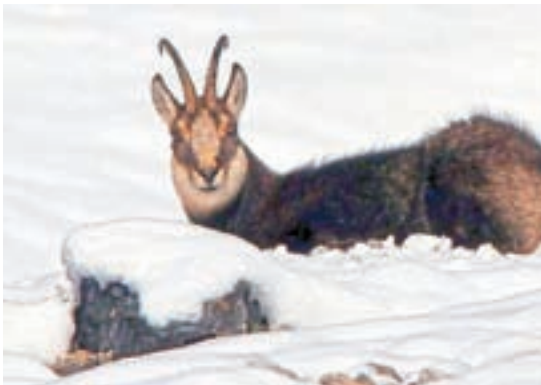
Gams v snegu

Še vedno sta v lovišču prisotni zaščiteni gozdni kuri divji petelin in gozdni jereb, a se zaradi obsežne sečnje, gradnje gozdnih cest in vlak, vznemirjanja s strani uporabnikov prostora (gobarji, izletniki ...) njun življenjski prostor manjša in verjetno jima bomo kmalu pomahali v slovo.