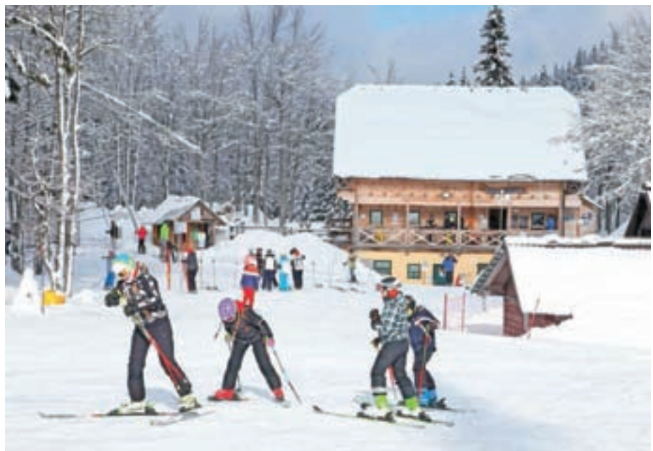
Glede na obilico snega nameravajo na Soriški planini obratovati vsaj do konca marca.

Zaradi epidemije in z njo povezanih ukrepov bodo v tej sezoni na smučiščih našli precej manj obratovalnih dni in smučarjev. Na Soriški planini so naprave pognali 18. decembra, a je po štirih dneh nastopilo slabo vreme in nato še ponovna prepoved obratovanja. "Po novem letu je ponovno močno snežilo in smo smučišče odprli 7. januarja, a smo